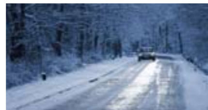
Niezawodny nawet w najsrozszej zimie: Mobil 1.