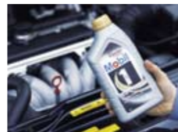
Mobil 1 z SuperSyn - najlepszy olej, jaki kiedykolwiek nosił nazwę Mobil 1.